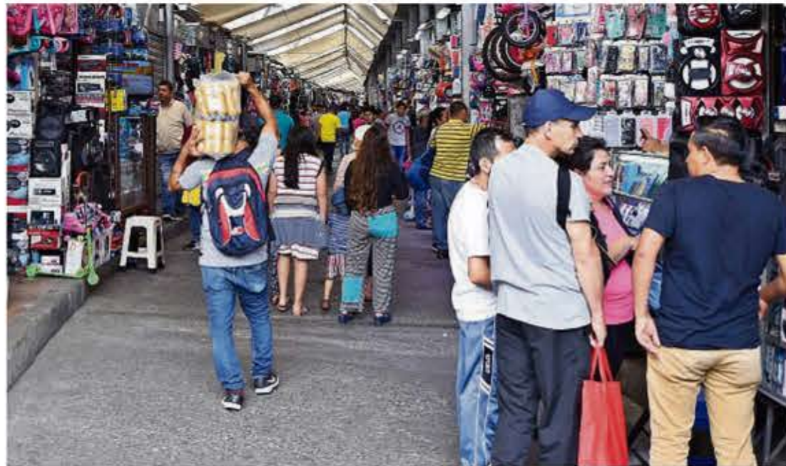
En sectores como la Bahía, en el centro de Guayaquil, se evidencia la informalidad en las ventas que repercute en la no contratación formal de los vendedores.

Los 3,5 millones que tienen empleo sin seguridad social pública perciben $ 132 al mes en promedio. Más 855.741 que trabajan sin recibir sueldo.