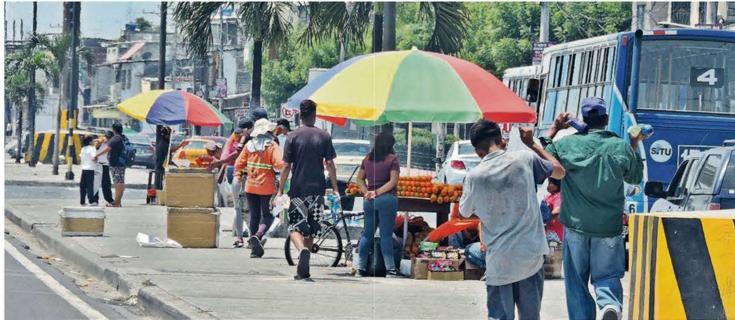
La informalidad del mercado laboral es visible en las calles con los vendedores ambulantes que no cotizan a la seguridad social, que en Ecuador es pública y obligatoria.