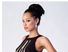
Críticas a nueva Miss Japón, Ariana Miyamoto, por no ser...