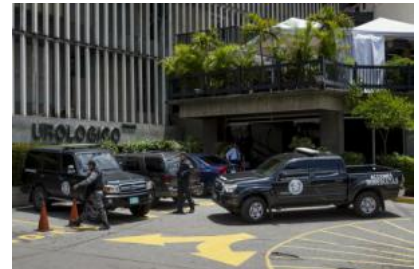
Antonio Ledezma fue operado de emergencia y con éxito