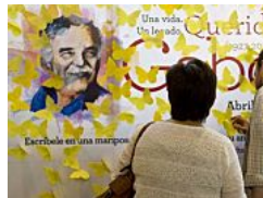
Las mariposas amarillas para recordar a Gabo