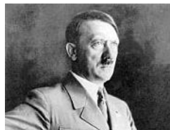
Hitler vivió en Sudamérica y se apellidó Kirchner, según libro...