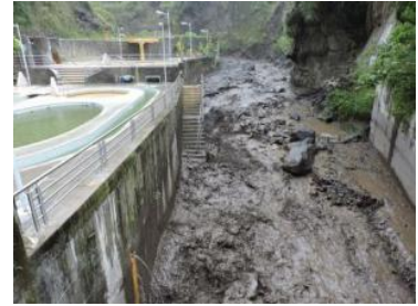
70 evacuados en piscinas de Baños