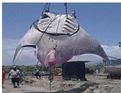
Manta raya gigante fue capturada en Tumbes