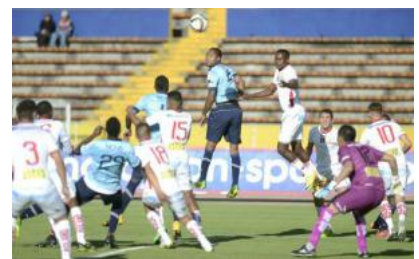
Universidad Católica cayó 1-3 con Liga de Loja en el Olímpico Atahualpa