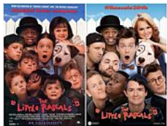
Los pequeños traviesos se reunieron por el 20 aniversario del estreno...