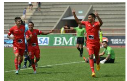
River Ecuador ganó 1-0 y se tomó revancha ante U. Católica