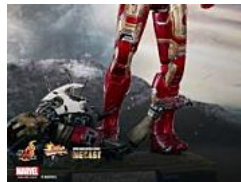
Muestran la nueva armadura de Iron Man